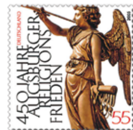
Abb. 7: Briefmarke „450 Jahre Augsburger Religionsfrieden“, 1995

Wer noch mehr von Efferts philatelistischer Kunst betrachten möchte, kann die zwischen 1989 und 2011 realisierten Entwürfe des Meisters dem Briefmarkenstandardkatalog Michel 3 bzw. dem Wikipedia-Eintrag zu Paul Effert mit der darin enthaltenen Bildersammlung entnehmen.