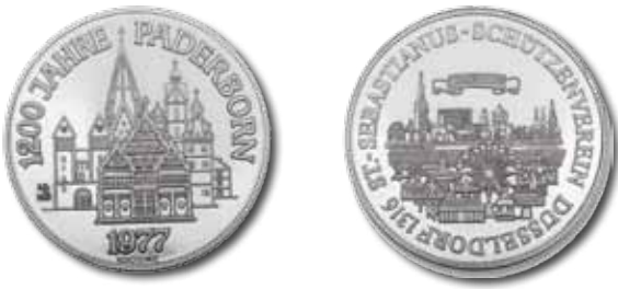
Abb. 8 und 9: Medaille „1200 Jahre Paderborn“, 1977, Silber, 36 mm; Medaille „Schützenverein Düsseldorf 1316“, o. J., Silber, 36 mm

grafien sind, wie der Künstler selbst sagt, die Essenz seines Lebenswerks. „Mondlicht“ ist der Titel einer Schriftmappe mit zarten Schriftkompositionen nach Gedichten von Rilke bis Hofmannsthal und japanischer Dichter, die den Künstler inspiriert haben. Als hätten die Buchstaben das Tanzen gelernt, schwebend und geheimnisvoll, heißt es im Klappentext zur Mappe (Abb. 10).