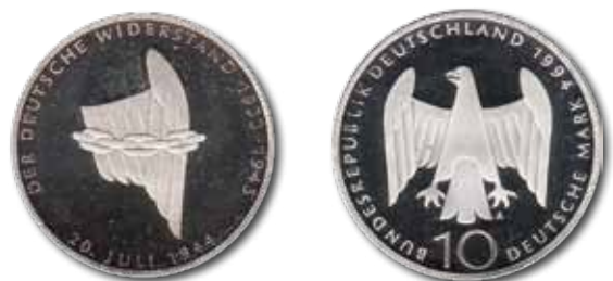
Abb. 4: 10 DM 1994, „Der deutsche Widerstand 1933–1945“

Fügen wir der künstlerischen Leistung Efferts ein Beispiel aus dem Schaffen für Gedenkmünzen an. Zweimal ging Effert als Sieger aus den künstlerischen Wettbewerben für Gedenkmünzen zu 10 DM hervor: 1989 für „2000 Jahre Bonn“ und 1994 „Der deutsche Widerstand 1933–1945. 50. Jahrestag des 20. Juli 1944“ (Abb. 4).