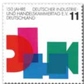
Abb. 5: Briefmarke „150 Jahre DIHK“, 2011, nicht ausgeführter erster Preis