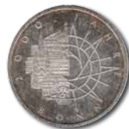
Abb. 6: 10 DM 1989 „2000 Jahre Bonn“, Vorderseite

Für den Entwurf zur Briefmarke zum Religionsfrieden vor 450 Jahren wählte Effert den berühmtesten Augsburger Gottesboten, den barocken Friedensengel von der Kanzel aus der gotischen St. Anna-Kirche (Abb. 7). Und wieder ist ebenbürtig die Schrift der Bildgestaltung gegenübergestellt.