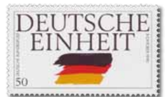
Abb. 3: Briefmarke „Deutsche Einheit“ 3. Oktober 1990

Pfennig von 1990 auf die Deutsche Einheit gehören für mich zu den eindrucksvollsten zeitgenössischen deutschen Briefmarkenlösungen (Abb. 3). Die mit dem Pinsel wie spontan auf den Entwurf gezogenen Farben schwarz-rot-gold kontrastieren mit den Versalien der klassischen Antiquaschrift. Der Entwurf übersetzt somit geradezu kongenial die Spontaneität und Erregung der Zeit in eine zeitlos gültige Perspektive. Die beiden Marken erfuhren eine Auflage von zusammen 95 Millionen Stück und könnten damit theoretisch jedem Alt- und Neubundesbürger zu postalischen Zwecken gedient haben.